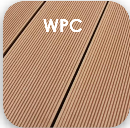
WPC, Gartenterrassen auf Ebene Erdgeschoss, Braun