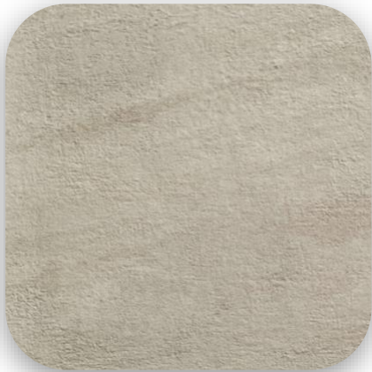
LOVE-Tiles, Canyon, 60x60, Grau